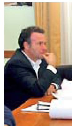
Da sinistra, in senso orario

PIANO CASA. Erano dieci a gennaio. Ed erano state tutte boccia-